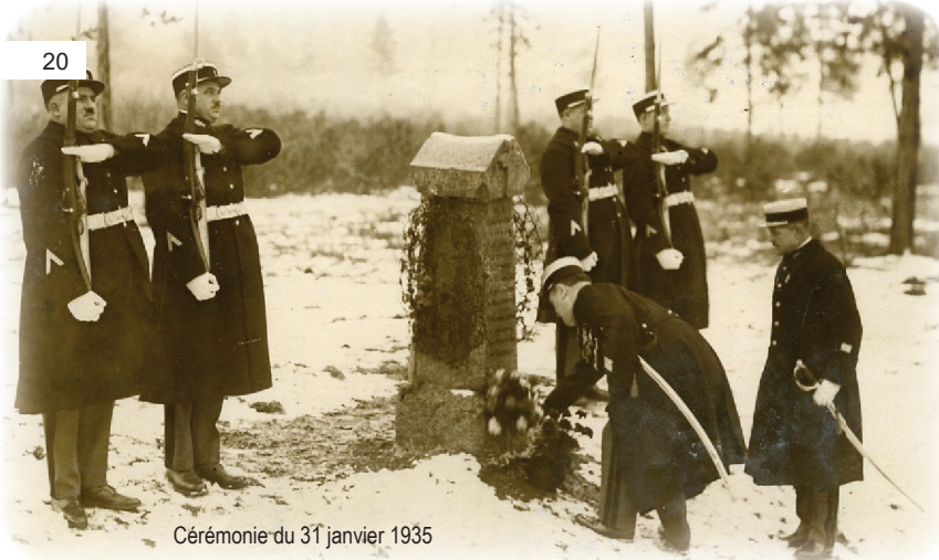
Cérémonie du 31 janvier 1935