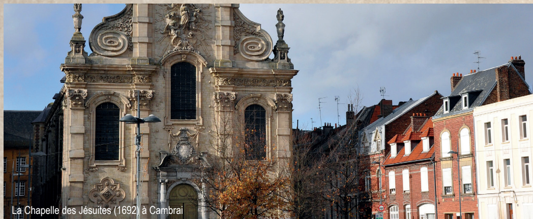
La Chapelle des Jésuites (1692) à Cambrai